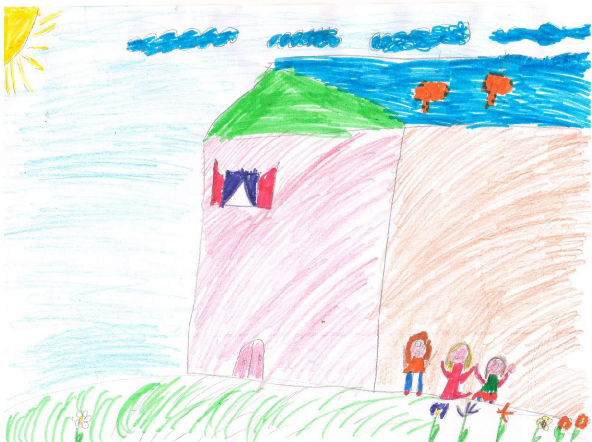
Künstlernamen unbekannt, Kinderzeichnung eines Hauses, Belarus.